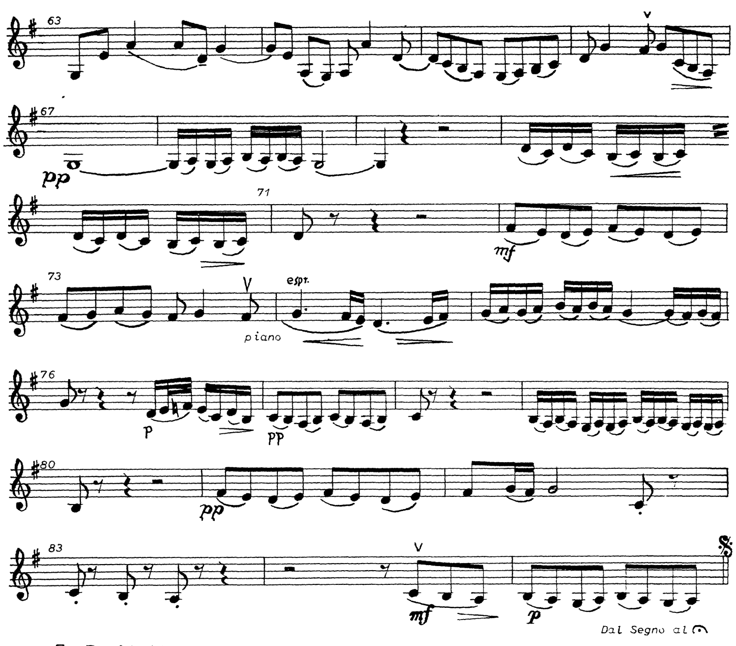
7. Rezitativo tacet (... den Heiland selbst zu sehen)