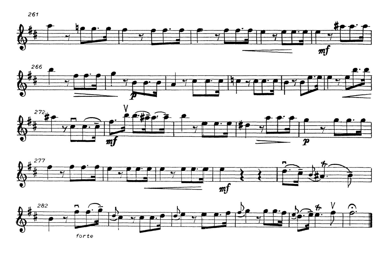
2. Duetto (e Chorus)