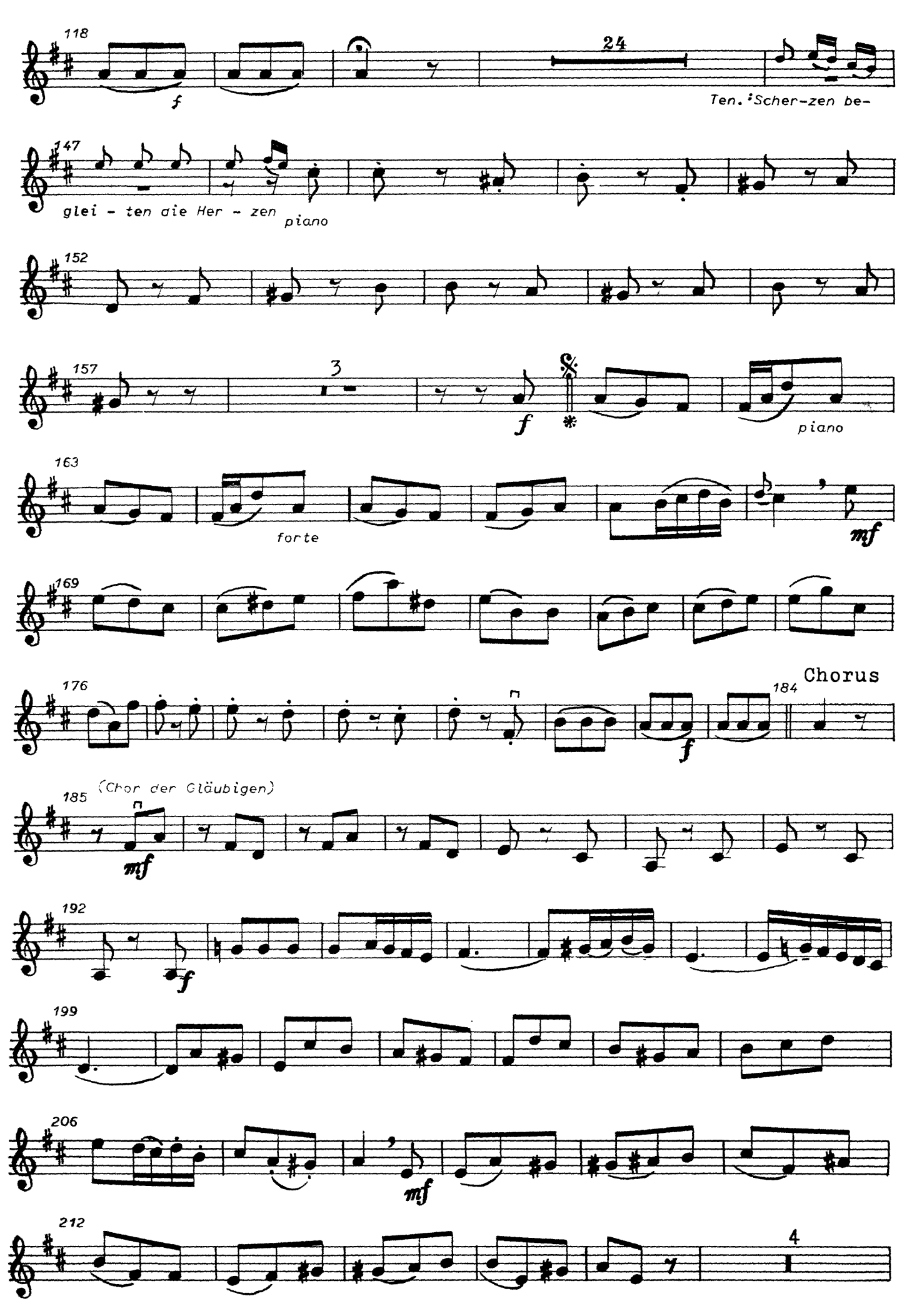
Fassung A: Dal Segno & al 🙃 Fassung B: gleich weiter