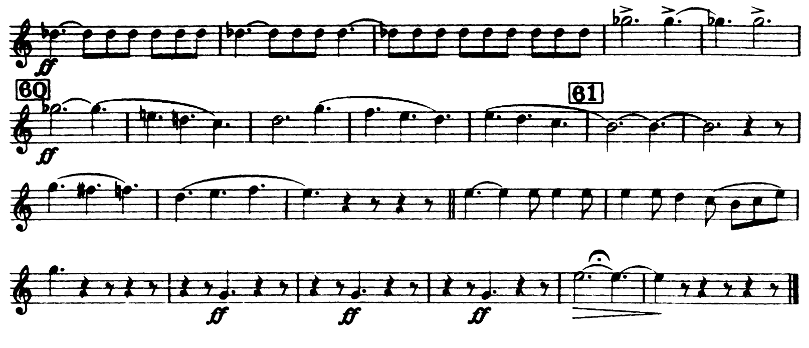
Nº 7 & Nº 8 tacent.