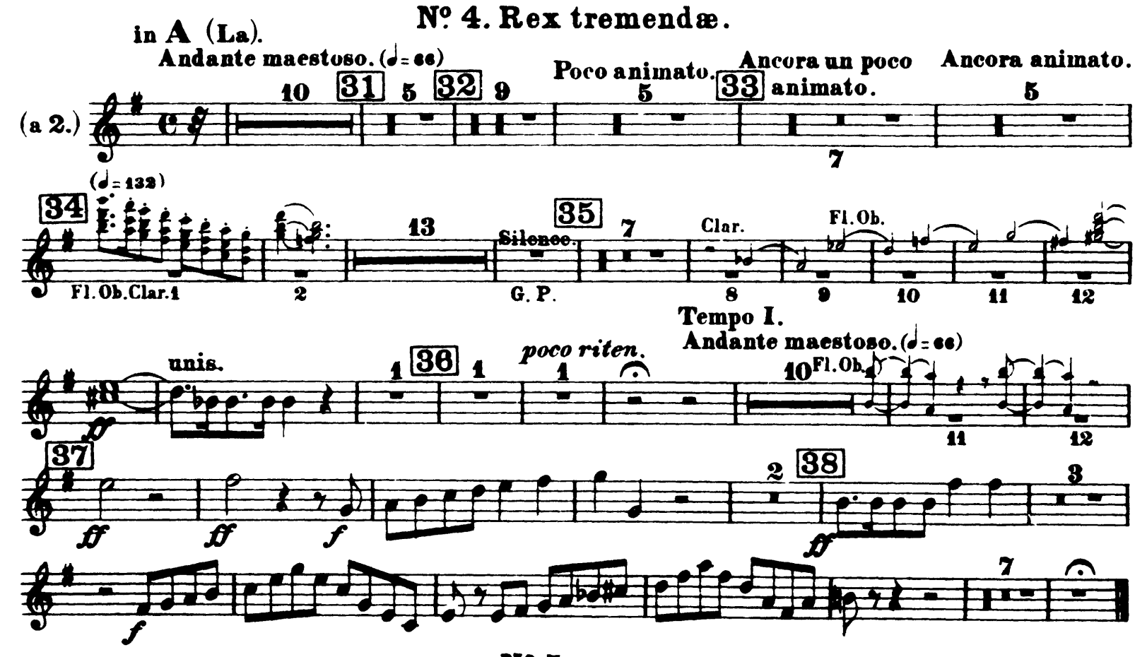
Nº 5. Tacet.