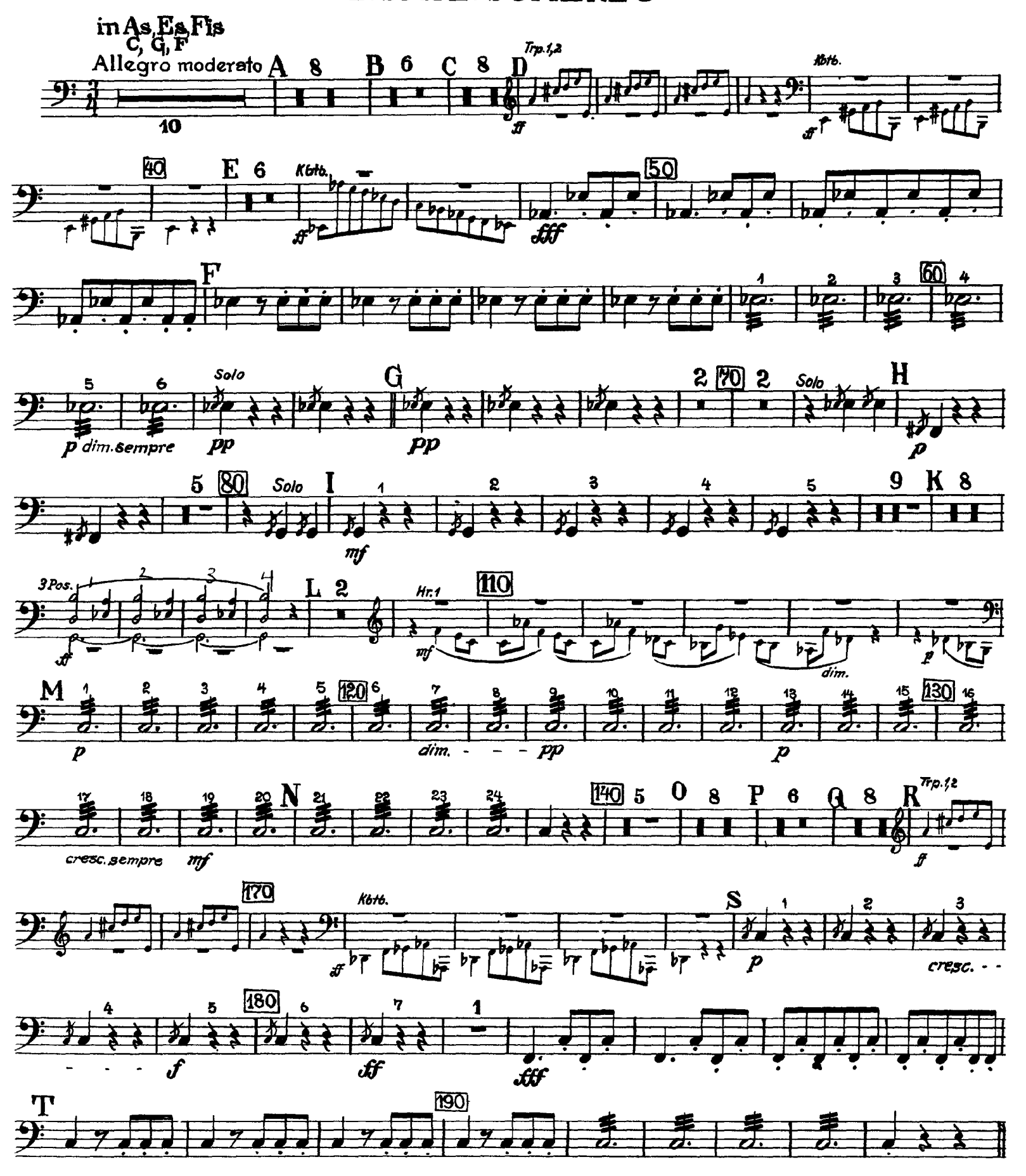
Trio tacet Nach dem Trio Scherzo da capo