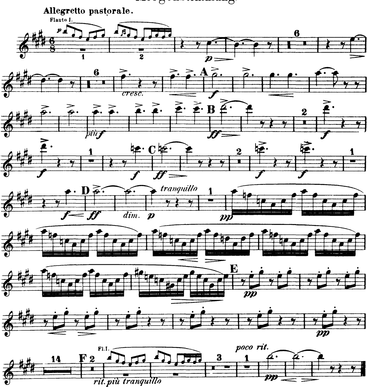
II. III. tacent.