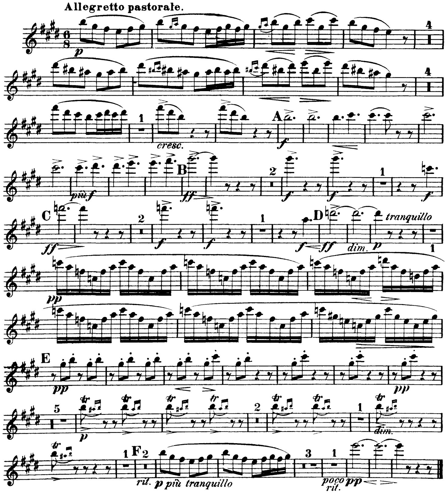
II. III. tacent.