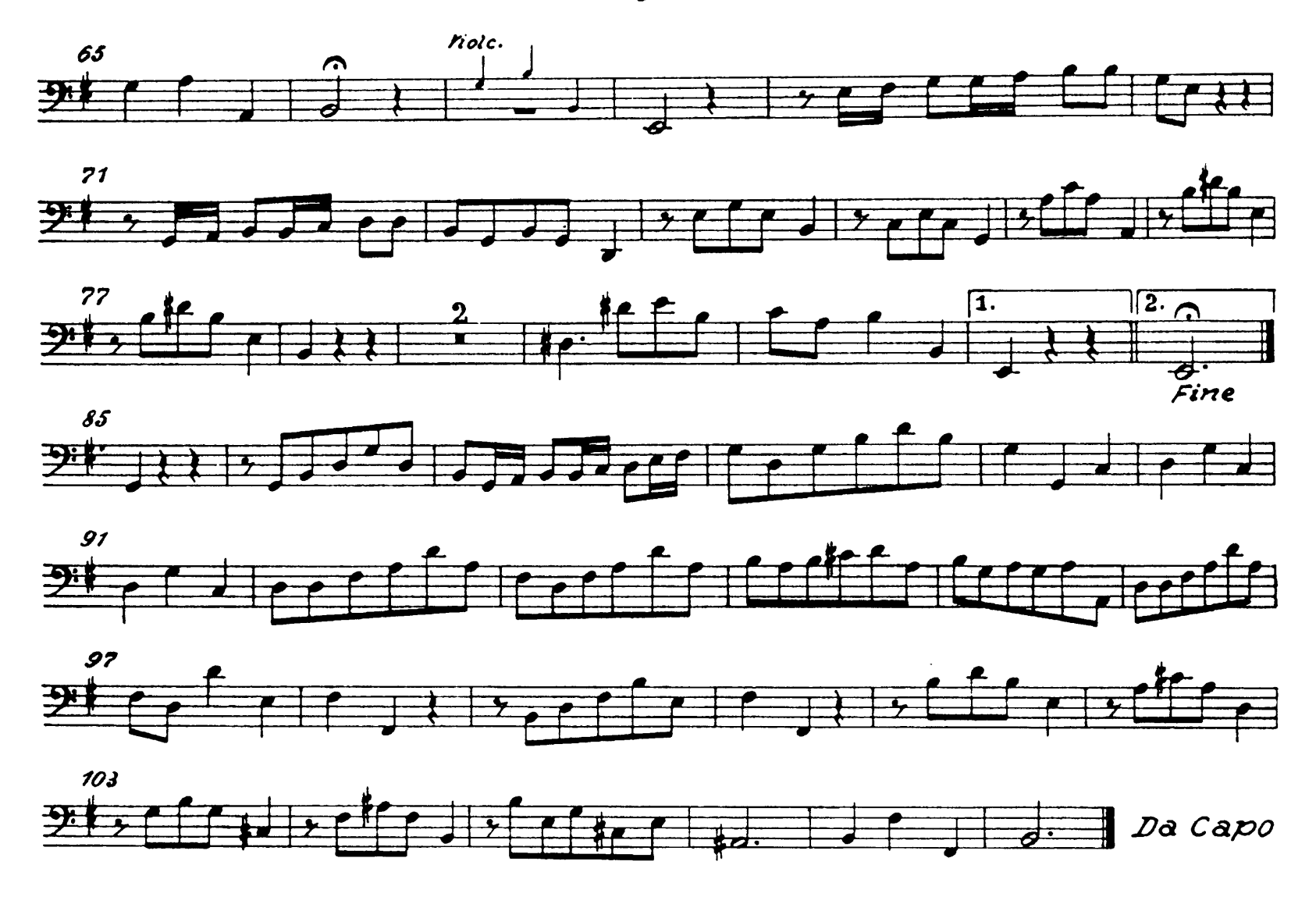
Fine dell' Atto secondo Ende des zweiten Aktes