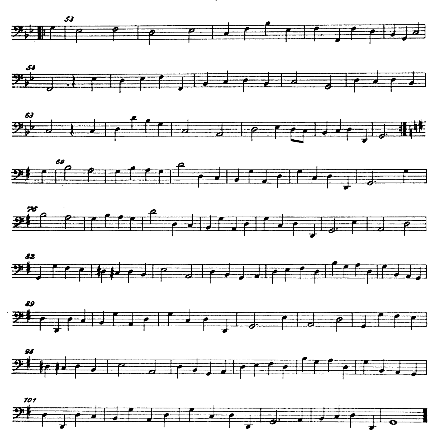
Fine dell' Opera Ende der Oper