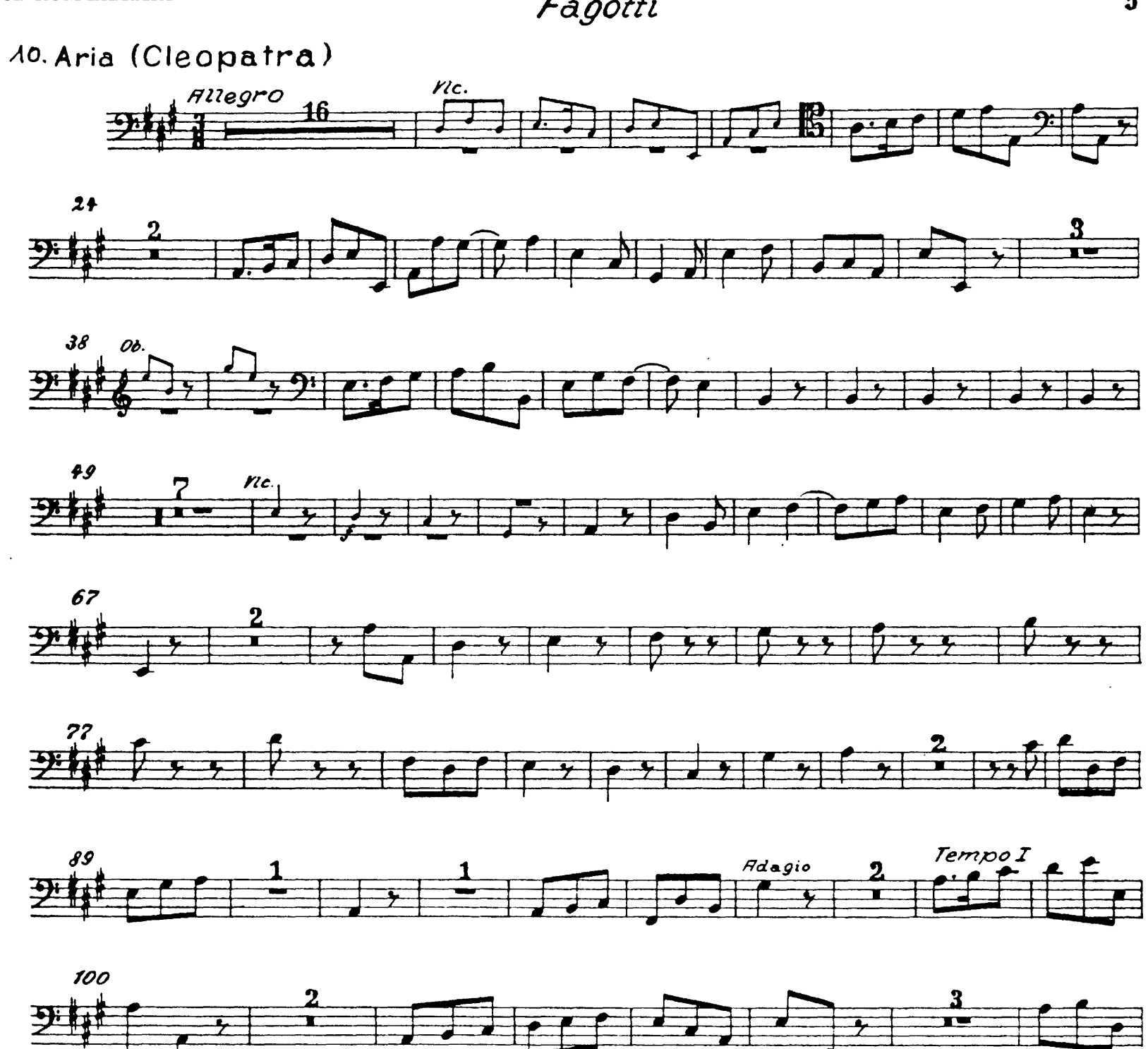
tacet al Fine dell' Atto primo Bis Ende des ersten Aktes: cacec